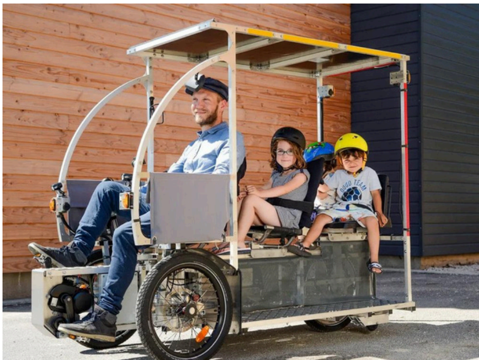
Le projet VIMob

> En savoir + : https://blogs.univ-brest.fr/ubo-durable/2024/06/12/lubo-recoit-le-prix-pour-le-mieux-commun-fncas-maif-2024/