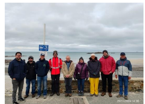
La délégation d'Amérique centrale et l'équipe OSIRISC lors de la mise en place d'un premier suivi terrain à Plérin (29/11/2024)