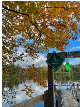
Parc naturel du Mont Saint-Bruno