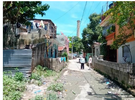
Villa Penca, quartier populaire de Bajos de Haina à proximité du port et de l'ancienne usine de production de sucre (12/05/2024)

Des échanges sont actuellement en cours entre plusieurs laboratoires de l'Institut Universitaire Européen de la Mer (LEMAR, LETG, LOPS) et des chercheurs de la Universidad Nacional de Costa Rica . Ces échanges devraient permettre la création d'ateliers ayant pour objectif le partage des compétences sur l'étude de la géomorphologie littorale et plus spécifiquement de l'érosion côtière ; et plus loin rendre possible une mission de terrain de plusieurs semaines sur les effets socioéconomiques et environnementaux de la construction d'un terminal à conteneurs à Puerto Moín, sur la côte caribéenne du Costa Rica.