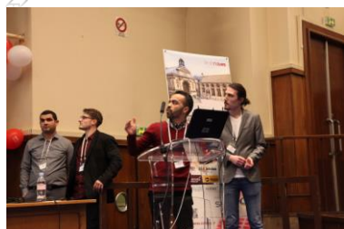
Présentation du Challenge 2018 par les étudiants OPEX

Les 30 et 31 janvier 2018 à Paris, avec l'appui du département de chimie, les étudiants du master CACQ-OPEX ont présenté à Chimiométrie 2018 leurs résultats sur un problème complexe de modélisation de 4000 spectres. Chaque étudiant a travaillé sur une méthode de résolution, et le groupe a présenté la synthèse de ses résultats. Sur 30 participants, les étudiants OPEX, avec une présentation de « Machine à Vecteurs de